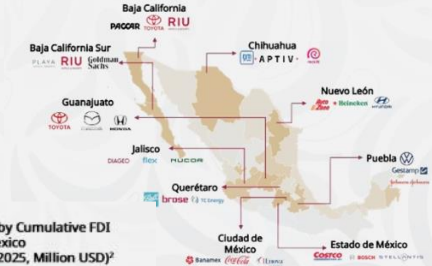
Figure 1. Top 10 Countries by Cumulative FDI Inflows to Mexico (January 2006 – September 2025, Million USD) 2